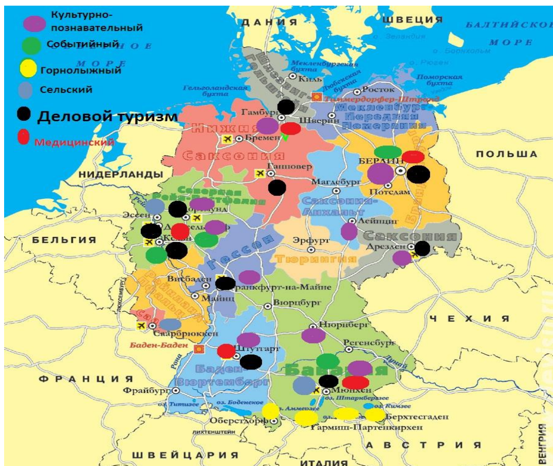
Рисунок 1 – Основные виды туризма в Германии (составлено автором по: [17]).