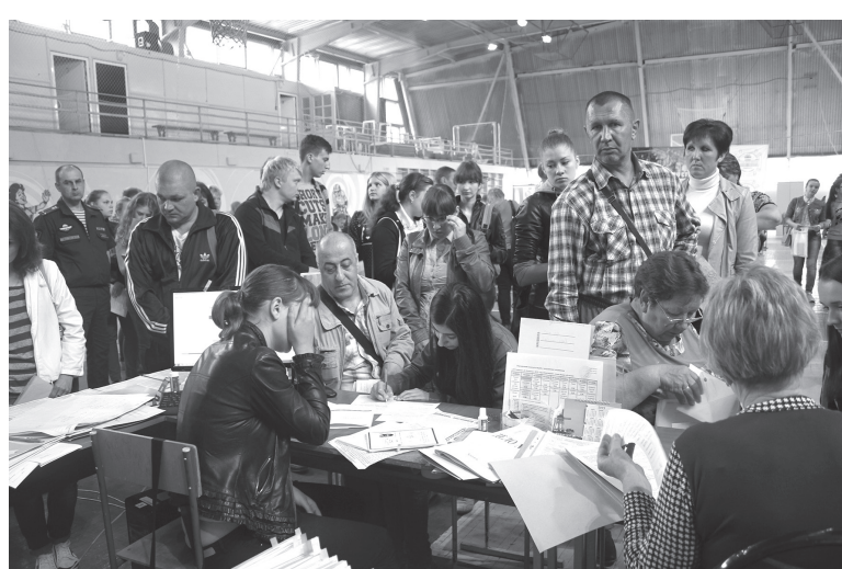
В приёмной комиссии РГУ имени С.А. Есенина. Лето 2015 года

Количество платных мест достаточно, чтобы поступили все желающие, имеющие результаты вступительных испытаний, заключившие с университетом договор об оказании платных образовательных услуг и оплатившие его. Приказ о зачислении на платной основе выйдет 20 августа. Следует обратить внимание, что минимальные проходные баллы едины для всех видов и форм обучения.